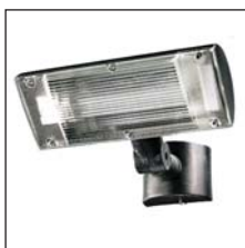
Für Wand- und Deckenmontage