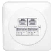
Standard PMI Ø58 mm