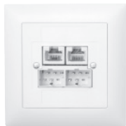
EDIZIOdue FMI 88x88 mm