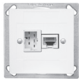
EDIZIOdue FM.TE-Apparat 60x60 mm