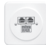
Standard P-Apparat Ø43 mm