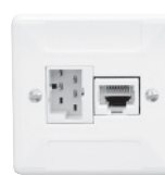
Standard P-Apparat Ø58 mm