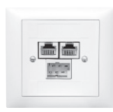
EDIZIOdue F-Apparat 60x60 mm