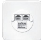
Standard PMI Ø43 mm