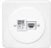
Standard PMI Ø58 mm