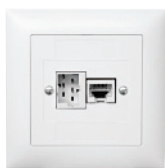
EDIZIOdue FMI 88x88 mm