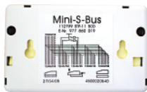
Minirépartiteur bus S 5x RJ45s