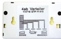
Miniverteiler 4ab 5xRJ45u