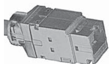
Douille modulaire blindée, Nexans LANmark-7 GG45