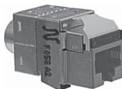
Douille modulaire blindée, LANmark-6 10G EVO