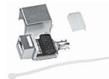
Douille modulaire blindée, ITplus®