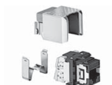
Douille modulaire blindée, ADC Krone