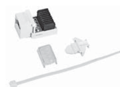
Douille modulaire non blindée, ITplus®