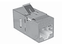
Prolongateur blindé, ITplus®