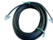
RJ11-kabel gekreuzt mit Flachkabel 4-polig